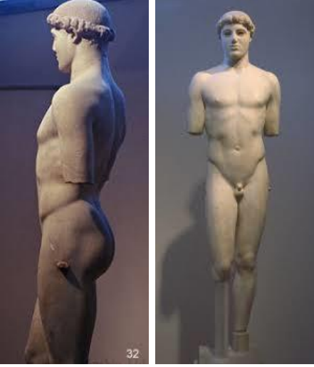
شكل ( ٧ )

شهد النحت في المرحلة الكلاسيكية تحولاً عن الفترة القديمة ليدخل مرحلة جديدة اتسمت بمحاولة الخروج عن الجمود الذي عرف في الفترة القديمة فثمة نوع من الدراسة للحركة التي منحت التماثيل نوعاً من الواقعية ومن اهم خصائص التحول :