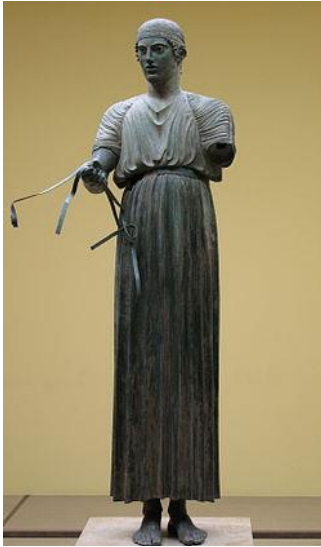
شكل ( ٨ )

تمثال من البرونز يبلغ ارتفاعه ١,٨٠ سم يعود تاريخه الى الربع الثاني من القرن الخامس ق. م شكل ( ٨ )