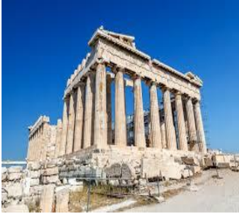
قلعة ومعبد الاكروبوليس شكل (١)

ان العصور المظلمة كمصطلح يطلق لتوصيف مرحلة تاريخية تتسم بأنخفاض مستوى التقدم والمعرفة وغالباً ما تنشأ العصور المظلمة بفعل كثرة الحروب او هيمنة ايدلوجية على ان ذلك لا يعني أن العصور الاغريقية المظلمة تخلوا من الإنتاج الثقافي والفني وهو ما يتضح عند دراستنا لفنون العصور المظلمة الاغريقية . فقد ضمت الفترة المظلمة تشكيلة من النتاجات الفنية كصناعة الفخار والنحت التي تميزت بأسلوب هندسي لذلك عرف فن الفترة المظلمة بمرحلة الفن الهندسي حيث يرد الباحثين ظهور ذلك الأسلوب الى أثينا التي أصبحت مركزاً لبلاد الاغريق بعد سقوط الدولة الميسينية اذ لجأ إليها العديد من سكان البلاد هرباً من الموت