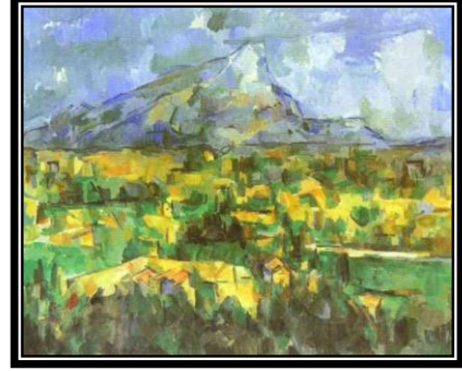
(شكل) بول سيزان، طبيعة ساكنة

كذلك، فقد عامل أشياء الطبيعة جميعها بإرجاعها الى أصول هندسية ثابتة تجلت "من خلال الكرة والاسطوانة والمخروط وكل شيء بمنظور تراكبي تصبح فيه جوانب الموضوع كأنه موجهة نحو النقطة المركزية" ٢ . وهو ما اسماه مبدأ المستويات المتداخلة والتي اعتمد فيها سيزان على رسم السطوح الهندسية ووضعها الى جانب بعضها خلافاً لما هو متعارف عليه في المنظور .