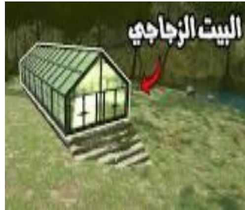
(البيت الزجاجي المفرد)