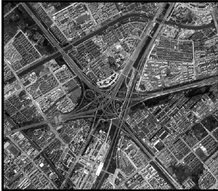
شكل (3 -24): الطرق والشوارع سهلة التمييز على الصور.

تظهر الطرق غالباً بلون فاتح إذا كانت غير مرصوفة أو ذات سطح خشن، وتظهر بلون داكن إذا كانت مرصوفة وملساء (شكل 3 -24). أما السكك الحديدية فمع أنها أسهل من حيث تحديدها على الصور من طرق السيارات نتيجة لانتظامها، إلا أنه يصعب تحديد عدد الخطوط. وعادة تعرف السكك الحديدية بوجود جسور خاصة أو أنفاق أو محطات للقطارات أو المنحنيات الخفيفة التي تتخذها قضبان السكك الحديدية.