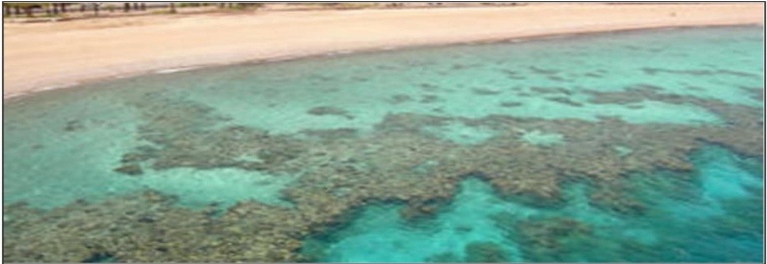
الشعاب المرجانية الحافية - Fringing reefs

توجد أربعة أنواع رئيسية للشعاب المرجانية: - الشعاب المرجانية التي توجد بالقرب من الشواطئ أو الملاصقة لها والتي تتواجد على طول خط السواحل وتسمى بالشعاب الحافية (التي تحف على طول خط الشواطئ).