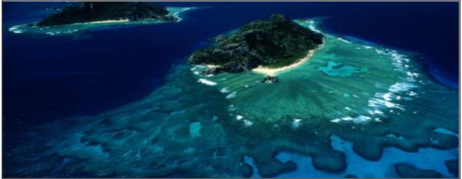
الجزر المرجانية - Reefs islands

- الشعاب الكبيرة فى الحجم والتي تنمو فى مستوى رأسى وأفقى حتى تصل إلى حجم كبير وتأخذ شكل الجزر المتناثرة لكنها تظل تحت سطح الماء وتسمى بالجزر المرجانية.