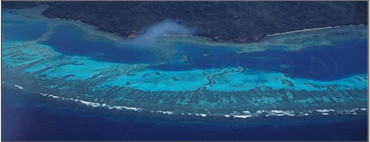
الشعاب المرجانية الحاجزية - Barrier reefs

- الشعاب التي تنمو بعيداً عن الشاطئ ولكن في خط موازٍ له حيث تبعد عن الشاطئ بعدة كيلومترات وتسمى بالشعاب الحاجزية.