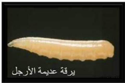
يرقة عديمة الأرجل