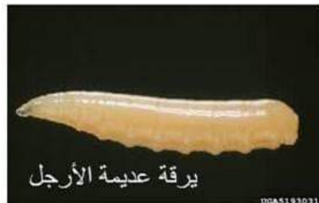
يرقة عديمة الأرجل