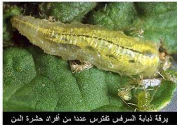
يرقة ذبابة السرفس تقترب عددا من أفراد حشرة المن