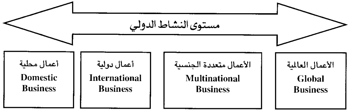
شكل (1- 5) : مراحل تحول الأعمال باتجاه العالمية