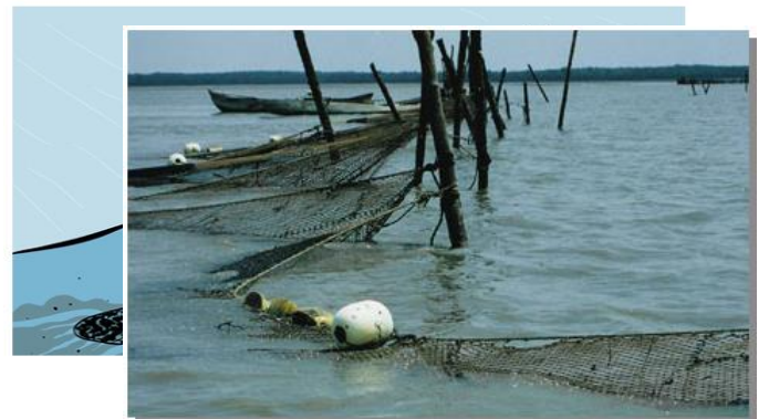
شكل (3) شباك القارب العمودية