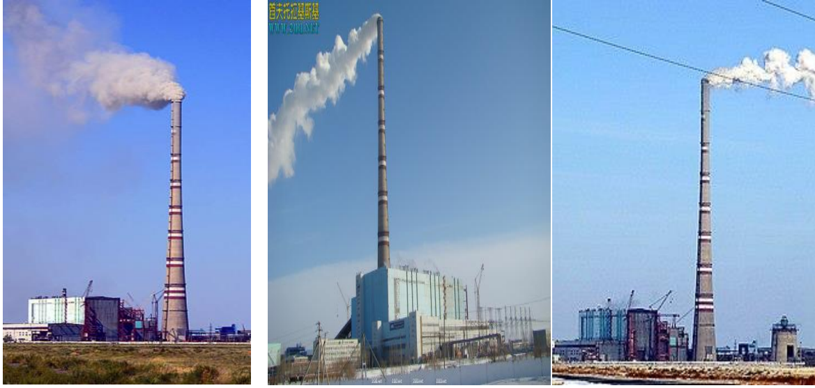
صور توضح تأثير اتجاه الرياح في حركة ملوثات الهواء