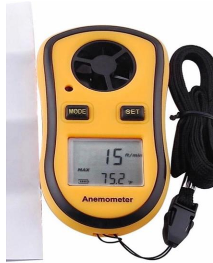
اجهزة قياس سرعة الرياح