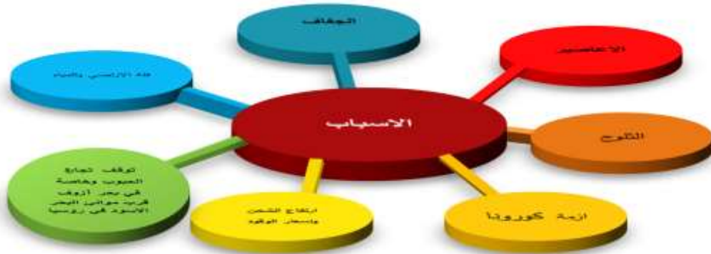
شكل (2) اسباب انخفاض الامن الغذائي في العالم 2022