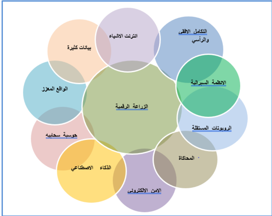
شكل (1) متطلبات التحول للزراعة الرقمية

هناك العديد من الفوائد والمردودات العائدة من الزراعة الالكترونية منها: 1- تغيير العمليات : اذ تقوم الزراعة الالكترونية على تغيير الطريقة التي يقوم بها العاملون في ميدان القطاع الزراعي من خلال جمع المعلومات الزراعية وتحليلها وتخزينها ومشاركتها لأغراض صنع واتخاذ القرارات اليومية. 2- الاستثمار: ان نمو وتطور الزراعة الالكترونية يشجع الاستثمار في البنى التحتية لتكنولوجيا المعلومات والاتصالات ورأس المال واليد العاملة.