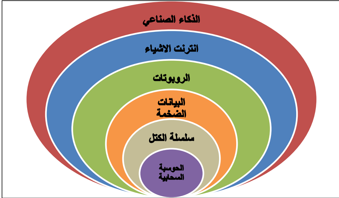
الشكل (2) : عناصر التكنولوجيا الرقمية

الطباعة ثلاثية الأبعاد والروبوتات ، والبيانات الكبيرة ، والتكامل مع الشركاء ، والحوسبة السحابية ، والتكامل الداخلي.