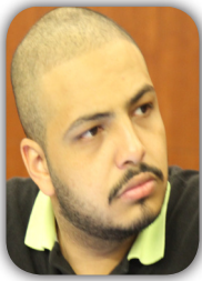
أ. إسلام العزيز مصر