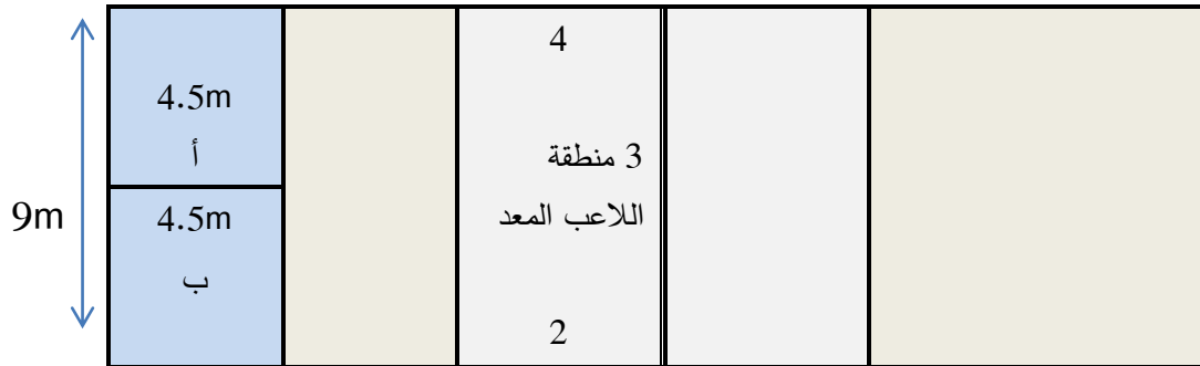
الشكل (1) يوضح اختبار دقة استقبال الإرسال

( صفر ) للكرة البعيدة عن الهدف ( اللاعب المعد ) ولا يمكن اعدادها