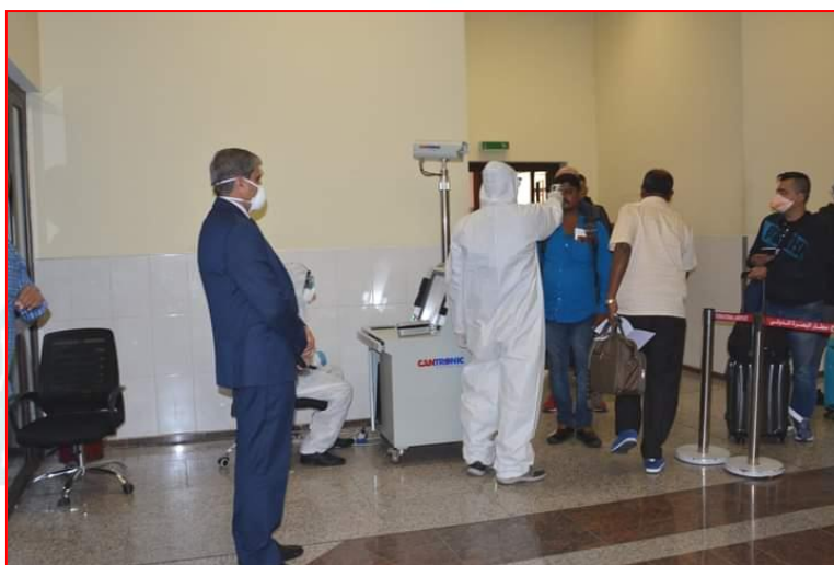
صورة رقم (١) إجراءات الفحص الطبي في مطار البصرة الدولي لعام ٢٠٢٠

وفي يوم ٢٣ تموز ( ٢٠٢٠ ) تم استحصال الموافقات لغرض فتح المطار لحركة الطيران ( الدولية والعربية والمحلية ) ، وحسب المعايير والضوابط والشروط الصحية المتعارف عليها في المطارات ، منها نصب أجهزة لأغراض الفحص ، ووضع البوسترات التوعوية والعلامات الإرشادية للتباعد بين أماكن وقوف وجلوس المسافرين وللتثقيف والتوعية ، فضلاً عن إجراءات التعقيم والتعقيم وغيرها ، بالإضافة الى الندوات والاجتماعات لخلية الأزمة المتواجدة في المطار وبالتنسيق مع صحة البصرة ، لغرض التوجيه والإرشاد ومناقشة اخر تطورات الأزمة في المنطقة صورة (١) ، صورة (٢) .