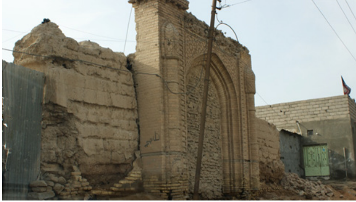
صورة (6) باب قصر آل زهير

المصدر: الدراسة الميدانية، صورت بتاريخ 20 / 10 / 2016