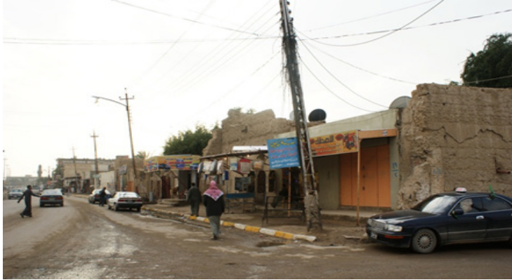
صورة (7) المحلات التجارية في البيوت العمرانية

المصدر: الدراسة الميدانية، صورت بتاريخ 20 / 10 / 2016