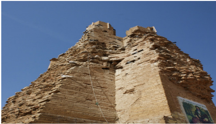
صورة (2) مسجد البصرة القديم (الخطوة)

المصدر: الدراسة الميدانية، صورت بتاريخ 20 / 10 / 2016