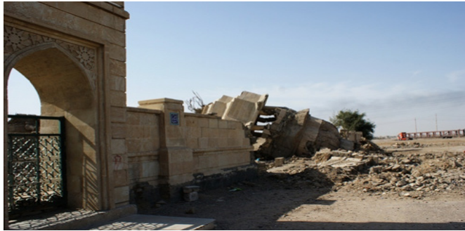
صورة (4) توضح الدمار في قبة وضريح طلحة بن عبيد الله

المصدر: الدراسة الميدانية، صورت بتاريخ 20/10/2016