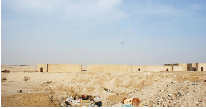
صورة (1) موضع مدينة البصرة القديم

صورت بتاريخ 20 / 10 / 2016