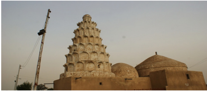
صورة (5) قباب ضريح الحسن البصري وابن سيرين