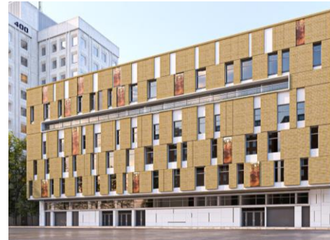
شكل (7): صور البناية قبل وبعد التنفيذ.