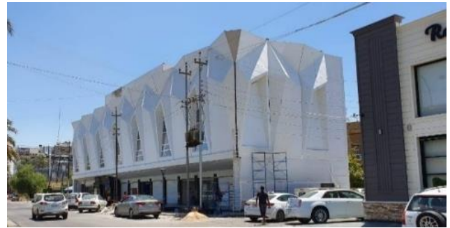
شكل (5): صور البناية قبل وبعد التنفيذ. المصدر: الباحثون بالإستناد إلى مصمم المشروع.