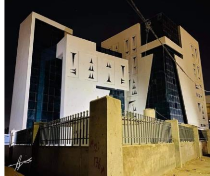
شكل (4): صور البناية المكتبة المركزية - العينة (A) قبل وبعد التنفيذ. المصدر: الباحثون بالإستناد إلى مصمم المشروع.