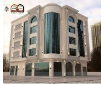
شكل (6): صور البناية قبل وبعد التنفيذ.

4.4.4. مصرف بغداد الرئيسي - بغداد/ العينة (D): يقع في العاصمة بغداد، الكرادة شارع النضال بمساحة (1600) م 2 صممت المخططات من قبل الشركة الايطالية Firenze - Italy CADINI GROUP ومكتب مُدن للاستشارات الهندسية، فرع العراق للمصمم ستار فليح. يتكون من ست طوابق مع طابق ارضي وسرداب. استوحى المصمم تصميمه من العمارة المحلية القائمة ومبدأ التناقض بين التصميم الخارجي (المحلي) والتصميم الداخلي (الحديث) أيضا بلمسه من الطراز المحلي. تم عمل الواجهات بمادة الطابوق (الجفقيم) وبتشكيلات مختلفة والطابوق هنا استخدم في الانهاءات وليس كمادة بنائية وهو استخدام مغاير لما مألوف كما استخدمت الستائر الزجاجية لتحقق التناقض او الحوار التشكيلي. اما التجربة الفراغية الداخلية فهي تجربة بصرية غنية تتسم بالشفافية المعمارية التي تجعل فراغات المصرف تتناسب مع الفراغ الداخلي التي تمثل وتجسد فكرة الانفتاح على الداخل الراسخة كنسق معماري عمراني جوهري في العمارة العراقية المحلية، والناحية الاخرى اسلوب المعالجات الخاصة و"غير التقليدية" لتصميم البهو الرئيسي، حيث خلق الفناء فكرة معمارية صريحة لخلق تواصل بصري بين جميع الطوابق مع تسقيفه بقطع زجاجية للاستفادة من أشعة الشمس ودخولها لجميع أجزاء هذا الفناء الذي نفذ باستخدام الهياكل الحديدية.