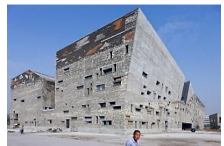
شكل (2): متحف نينغبو Ningbo التاريخي، مصنوع من الركام المحلي بطريقة تسمى "وا بان".

5.1.3. الصنعة الدقيقة Careful Workmanship: يشير مصطلح صنعة إلى جودة تحقيق مخطط التصميم، فضلا عن جودة تنفيذ التصورات والمخططات للمصمم (Risatti, 2009). يبين رينزو بيانو، بأن عملية التصميم المعماري دائرية، تنتقل من فكرة إلى رسم، ومن رسم إلى تجربة، ومن بناء إلى فكرة مرة أخرى. لا تعمل هذه الخطوات بصورة مستقلة فهي مترابطة مع بعضها البعض ويكمل أحدها الآخر، وباختصار، فإن جودة ودقة الصنعة والعمال المهرة، أمران حيويان لعملية البناء في حرفة العمارة (Balik et al., 2017). فالمقارنة بين الوسائل المستخدمة والنتيجة ونية الحرفيين والتصميم نفسه يعطي دليلاً على وجود الصنعة الدقيقة وبالتالي البناء الحرفي وتأثيره على العمارة المبنية (Herres, 2014, p. 15).