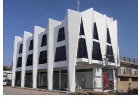
شكل (8): صور البناية قبل وبعد التنفيذ.