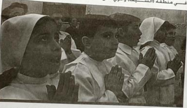
القدسية ( التي تقع في أحد محال منطقة البصرة الضرية وحدثاً في محلة (نظران) مقابل أسسه جوامع المسلمين وقد بنيت على طراز الشناشيل البصرية سنة ( ١٩٠٨ ) وحوي على

(المسيحية) في البصرة . ومن أشهر الكنائس في منطقة البصرة القديسة والتي لا زالت شاهقة التي يومنا هذا هي كنيسة الأرمن (١٧٢٦ م ) ويقع في منطقة السيفيا وحوي على