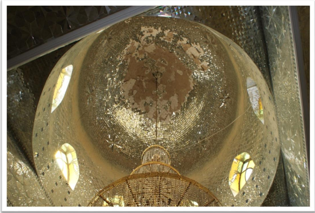
المصدر: الدراسة الميدانية, صورت بتاريخ 2016 /10/20