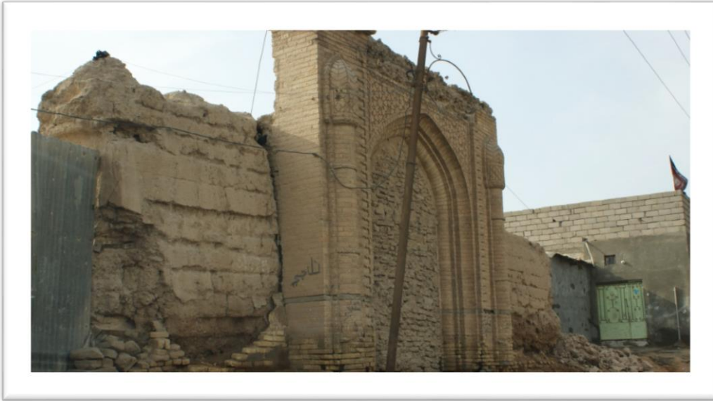
صورة (6) باب قصر آل زهير

المصدر: الدراسة الميدانية, صورت بتاريخ 2016 /10/20