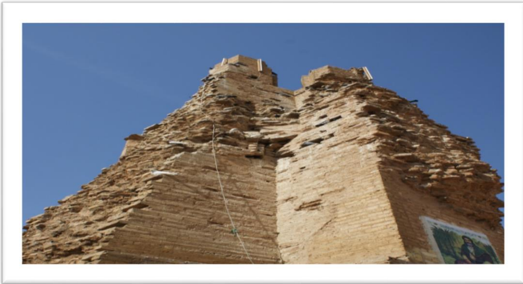
المصدر: الدراسة الميدانية, صورت بتاريخ 2016 /10/20