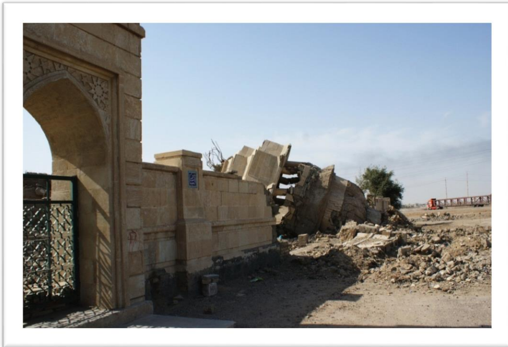
المصدر: الدراسة الميدانية, صورت بتاريخ 2016 /10/20