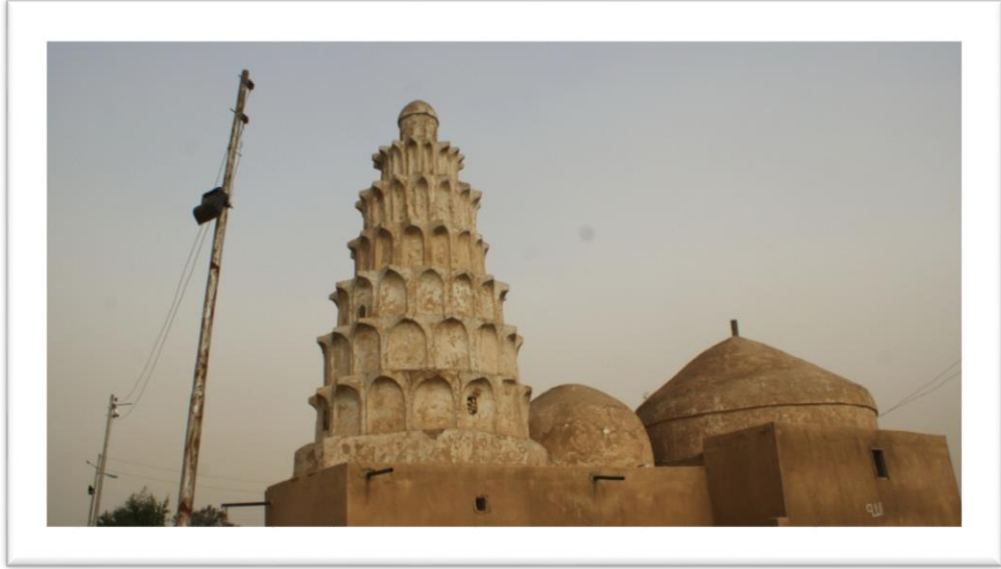
صورة (5) قباب ضريحا الحسن البصري وابن سيرين

المصدر: الدراسة الميدانية, صورت بتاريخ 2016 /10/20