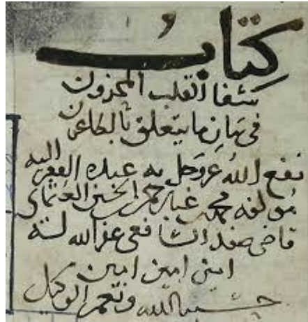
كتاب (شفاء القلب المحزون في بيان ما يتعلق بالطاعون/مخطوط) للقاضي صفد محمد القرشي (ت