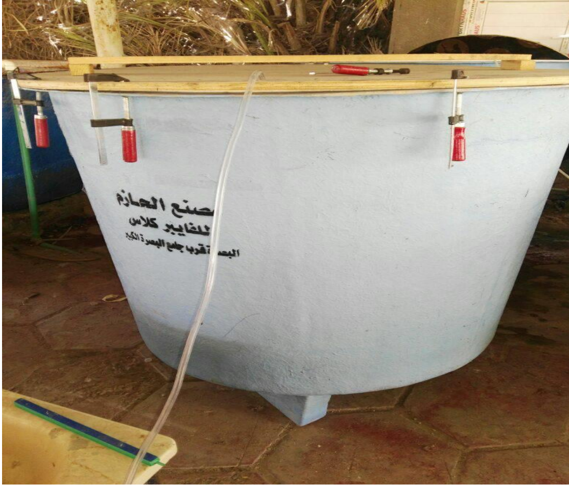
صورة ل احد احواض المصممة لنقل الاسماك

أضيف ملح الطعام بمعدل ٢٥٠غم/١٠٠لتر. وضع في كل حوض ١٠٠ لتر ماء، قيست أطوال الأسماك وأوزانها وكانت معدلاتها ٧,٦ سم و ٦,٣٧ ملغم.