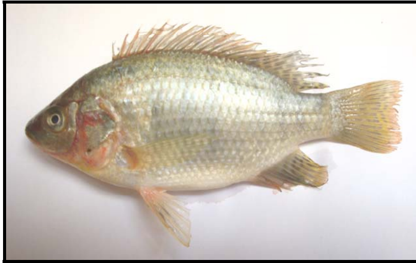
شكل 2: نموذج سمكة O. aureus .

توضح الشكل 2 النوع O. aureus ، التي تراوحت مديات أطوالها بين 100-121 ملم، يتصف هذا النوع بالجسم المرتفع، إذ تراوح عمقه نسبةً لطوله القياسي بين 44.7-50.07% وكذلك طول الرأس بين 34.48-36.55% (جدول 1)، لون الجسم رمادي مزرق غامق عند الظهر فضي عند البطن، توجد أحياناً بعض الخطوط العمودية الغامقة، يحوي الجزء الخلفي من الزعنفتين الظهرية والمخرجية بقع غامقة تتعاقب مع بقعاً مضيئة، الزعنفة الذنبية ذات لون غامق مع خطوط خفيفة والحافة حمراء، لا تحتوي بقية الزعانف على بقع، الزعنفة الظهرية طويلة وتحتوي على 15 شوكة في المقدمة و10 أشعة ناعمة، الزعنفة المخرجية ذات 3 أشواك و8-9 أشعة ناعمة، الحراشف من النوع القرصي cycloid ويتراوح عددها على الخط الجانبي بين 31-30 حرسفة (جدول 2)، عدد الأسنان الغلصمية على القوس الغلصمي الأول 22 سنناً (شكل 4)، الأسنان في الفك السفلي ذات 3-4 صفوف (شكل 5)، العظم البلعومي مثلث الشكل وذو أسنان كثيفة (شكل 6).