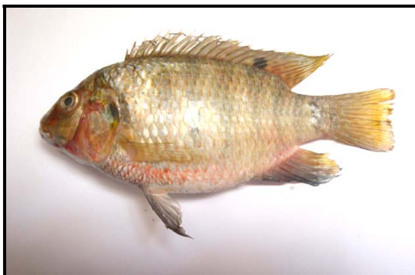
شكل 3: نموذج سمكة T. zilli .

يبين الشكل 3 النوع T. zilli ، التي تراوحت مديات أطوالها بين 105-162 ملم، يتميز هذا النوع بالجسم العميق، إذ تراوحت نسبته من الطول القياسي بين 42.8-47.46 %، فيما تراوح طول الرأس بين 33.28-34.47 % من الطول القياسي (جدول 3)، لون الجسم بني غامق مع خطوط غامقة في بعض مناطقه، توجد بقع غامقة على الأشعة الناعمة للزعانف الظهرية والمخرجية والذنبية، الزعنفتان الظهرية والذنبية ذات حواف حمراء بنية، الجزء العمودي من الرأس ذو لون أحمر غامق، تحتوي الزعنفة الظهرية في مقدمتها على 15 شوكة و 11 شعاعاً ناعماً وتحتوي الزعنفة المخرجية على 3 أشواك و 8-9 أشعة ناعمة، الحراشف من النوع cycloid وتراوح عددها على الخط الجانبي 30-33 (جدول 4)، بلغ عدد الأسنان الغلصمية على القوس الغلصمي الأول 13 سناً (شكل 7)، الأسنان في الفك السفلي ذات 5-6 صفوف (شكل 8)، الأسنان البلعومية كثيفة (شكل 9).