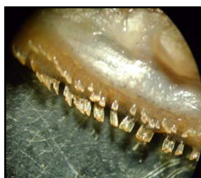
شكل 5: أسنان الفك السفلي في النوع O. aureus