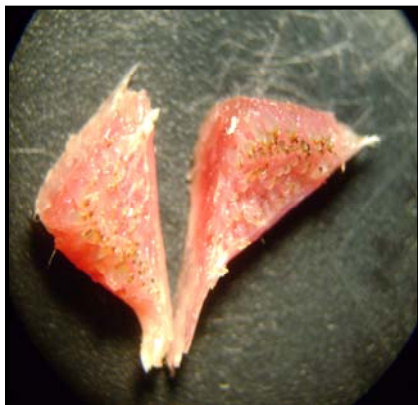
شكل 9: الأسنان البلعومية في النوع T. zilli