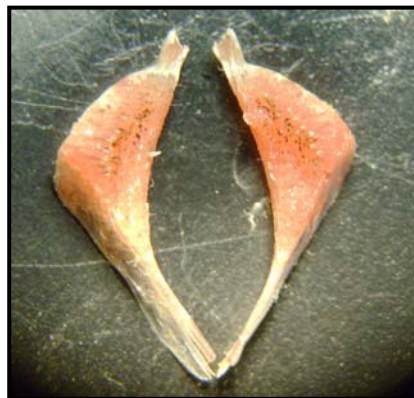
شكل 6: الأسنان البلعومية في النوع O. aureus