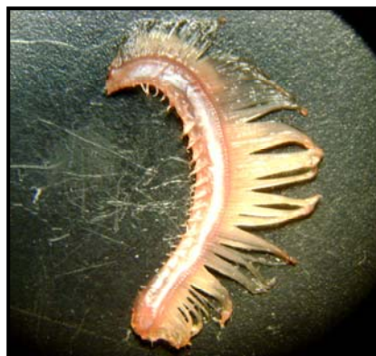
شكل 7: الأسنان الغلصمية في النوع T. zilli