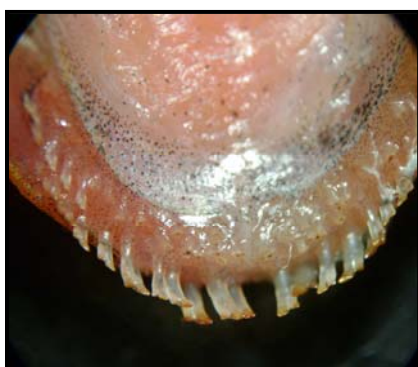
شكل 8: أسنان الفك السفلي في النوع T. zilli