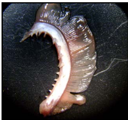
شكل 4: الأسنان الغلصمية في النوع O. aureus